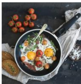
Menüservice & KiTa Menüpläne