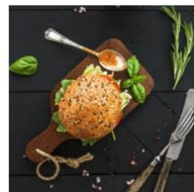
Menüservice & KiTa Bestellen & Anmelden