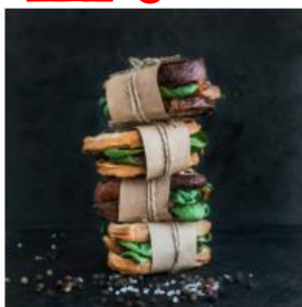
Speisekarte Restaurant Allergenekarte auf Anfrage